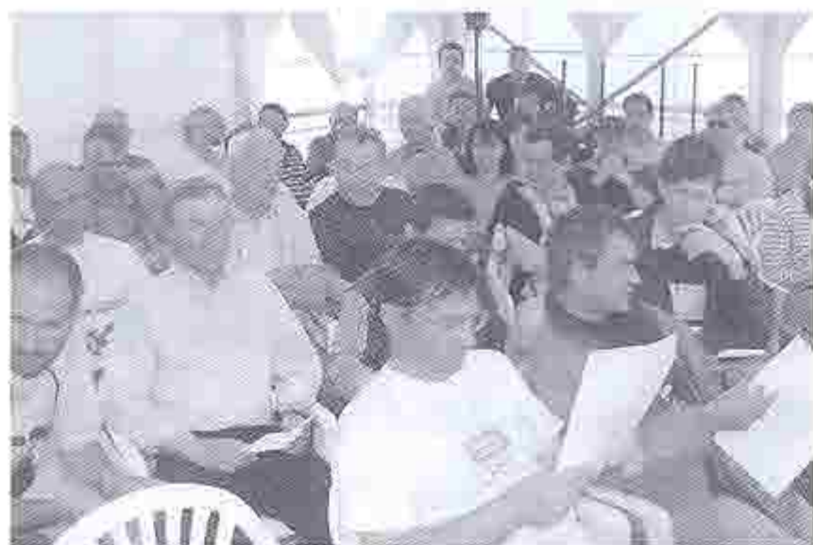
Sérieux le briefing

Vendredi 31 Mai après-midi : montage du bateau à Poole. Spi ou pas spi ? La météo anglaise annonce de l'Est, donc pas spi, mais la météo française annonce du Nord Est donc spi, mais une autre source annonce du Sud Est, donc pas spi.