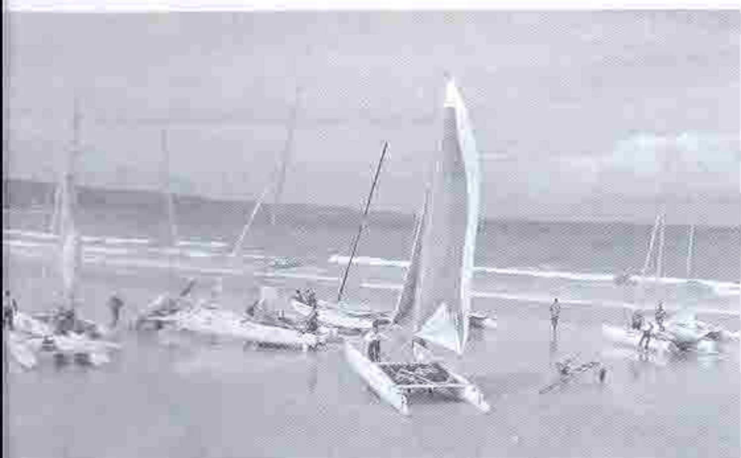
Départ de la sélection

Ça nous a pris un mardi d'automne entre une pizza et un spaghetti bolognaise, après avoir trinqué au lait fraise, avec une phrase du genre "t'as pas envie de faire la manche ?". Et Quinquin et Ramses se toisent la main ! N'ai pas peur, marin, rien à voir avec un parti pris, on ne parle pas d'argent ici, d'ailleurs la parole est d'or ! Rendez-vous au salon nautique sur le stand de Cherbourg assis par terre à visionner la vidéo du 2001. Le rêve ! Contact avec Christophe, hiver, printemps, les info arrivent. Une présélection fin avril, matériel de sécurité complet, c'est quoi une lampe flash ? Ca marche comment un GPS et une VHF ? 30 inscrits pour douze sélectionnés dont trois désignés d'office, reste 9 places sur 27 avec plein de locaux et de F18. Objectif : la sélection.