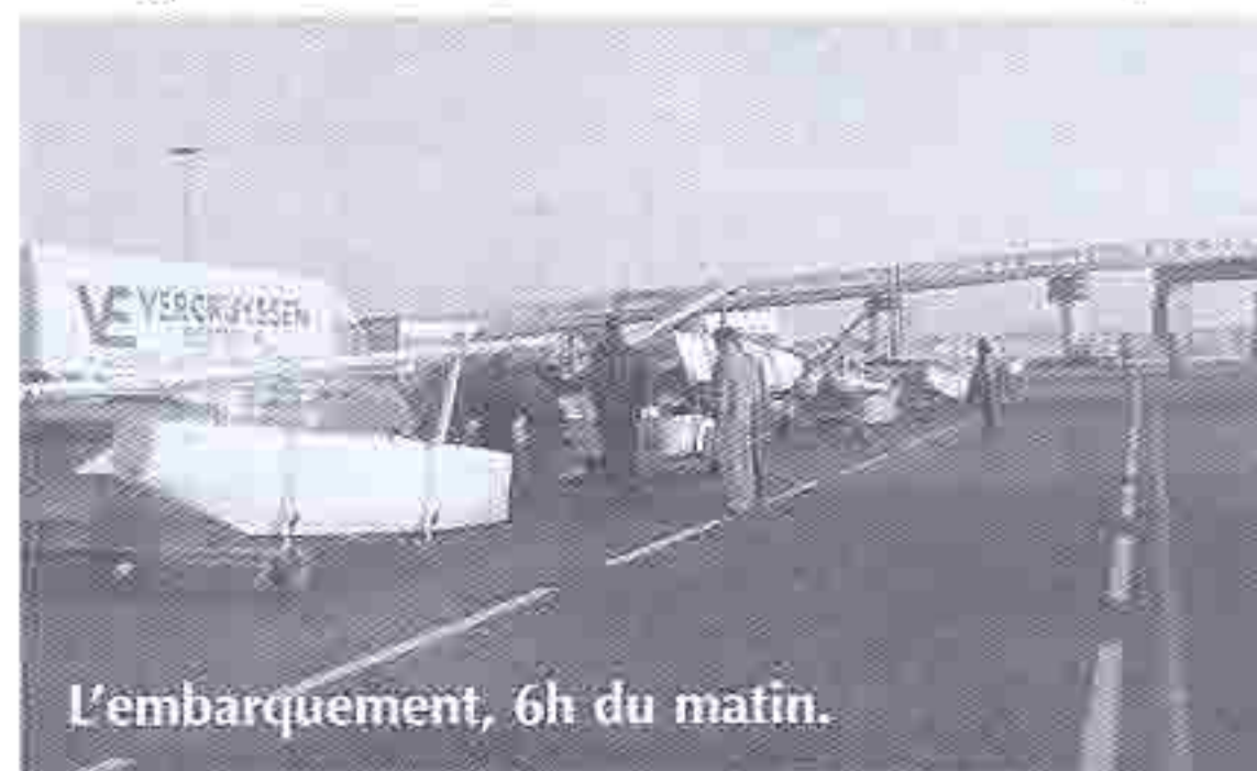
L'embarquement, 6h du matin.

Le soir : grande fête dans la salle des fêtes comme le font très bien les cherbourgeois, annonce des sélectionnés et signature des règles de sécurités et du petit chèque pour l'inscription Transmanche (ici, c'est la seule fois où nous parlerons d'argent: inscription à 1000 Francs pour